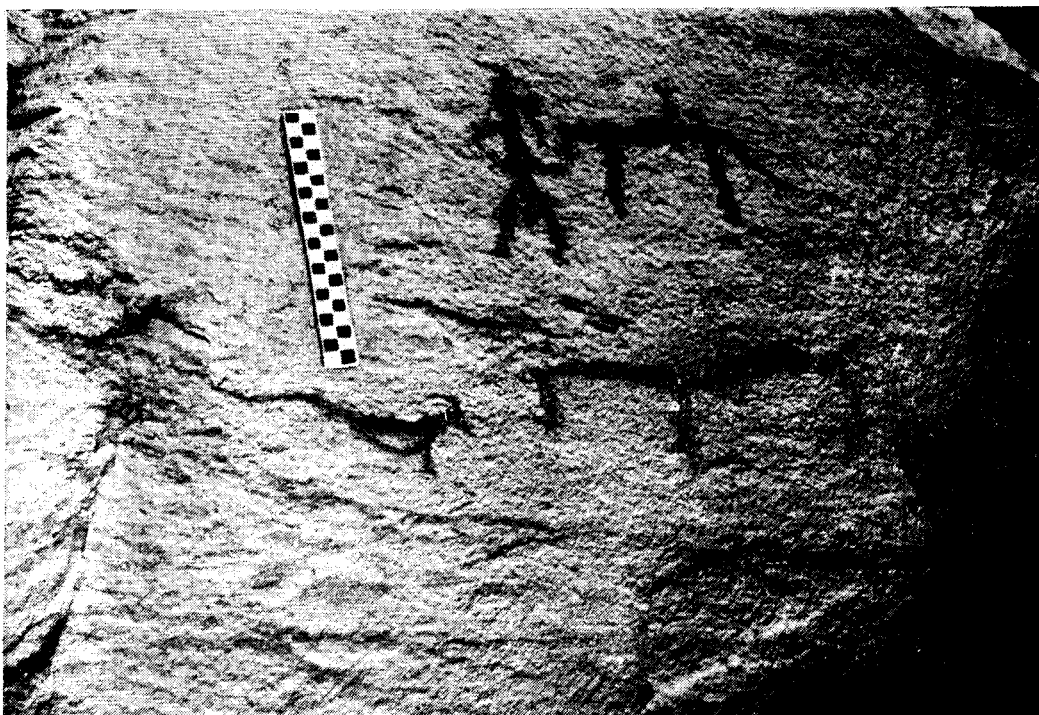
Фрагмент писаницы тюркского времени. Уроч. Каскабулак

В скифо-сибирском стиле выполнены вереницы архаров, козлов, маралов с характерной орнаментальной стилизацией. Основная масса петроглифов да-